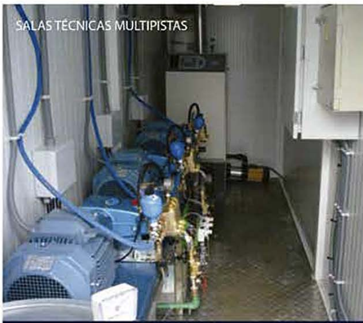
SALAS TÉCNICAS MULTIPISTAS