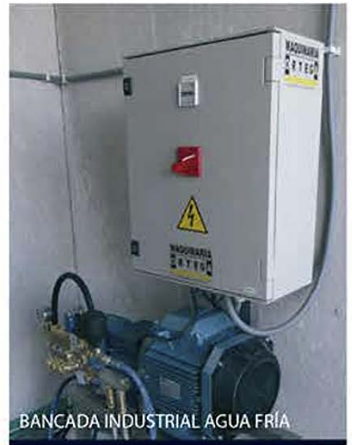
BANCADA INDUSTRIAL AGUA FRÍA

Bancadas Inox AISI304, Bombas CAT, Motores ABB, Calderas ACV o ROCA según necesidades, Cuadros eléctricos estancos IP66, con autómata o maniobra electromecánica, ... En definitiva; lo que su empresa pueda necesitar.