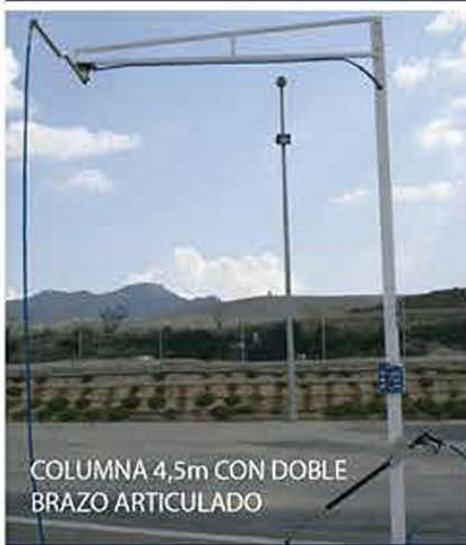
COLUMNA 4,5m CON DOBLE BRAZO ARTICULADO