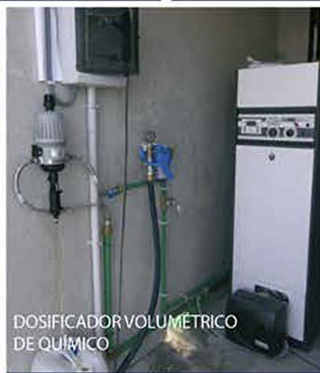
DOSIFICADOR VOLUMÉTRICO DE QUÍMICO