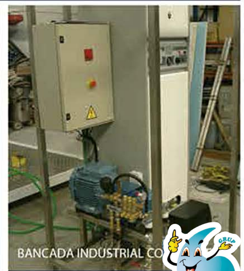
BANCADA INDUSTRIAL CO