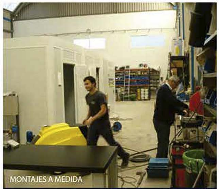
MONTAJES A MEDIDA